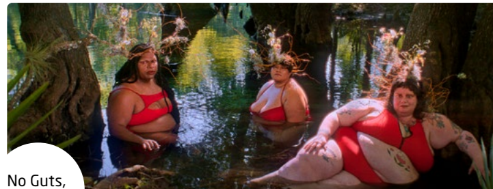
No Guts, No Glory