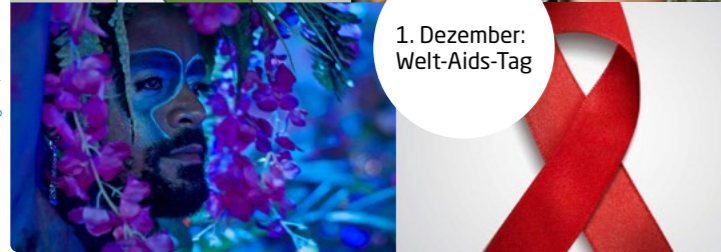
1. Dezember: Welt-Aids-Tag