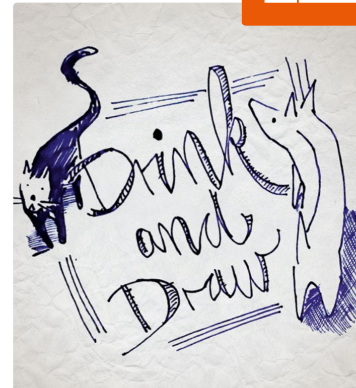
Zeichnung: Drink and Draw