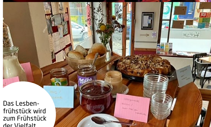
Das Lesbenfrühstück wird zum Frühstück der Vielfalt